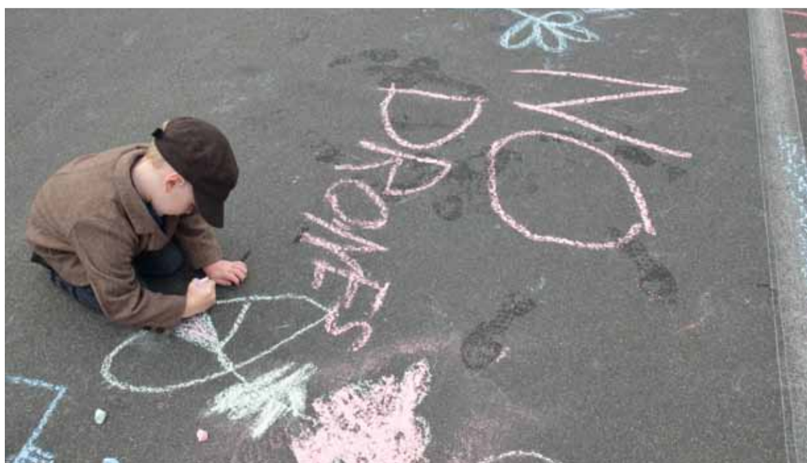
Proteste gegen Drohnen in den USA