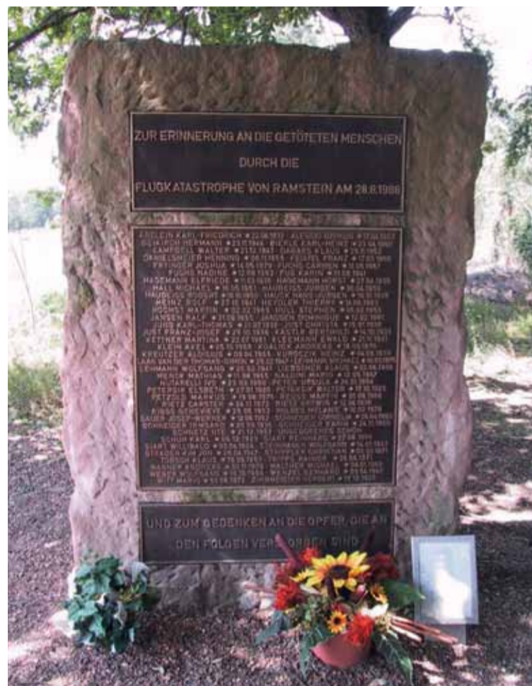
Ramstein Memorial zur Flugkatastrophe 1988

Von hier aus werden Einsätze auf dem afrikanischen Kontinent koordiniert, wegen vielfältiger geostrate-