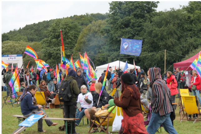
Foto: Unser Friedenscamp (2017) als Ort für Kultur und Kommunikation

Friedenspolitischen Forderungen sehen wir auch im Kontext der neoliberalen Politik und dem gesellschaftlichen Rechtsruck. In einer Vielzahl von Seminaren und Diskussionsrunden wollen wir politisches Wissen und Handwerkzeug vermitteln, um dieses in Aktionen für notwendige Veränderungen in der Politik einzubringen.