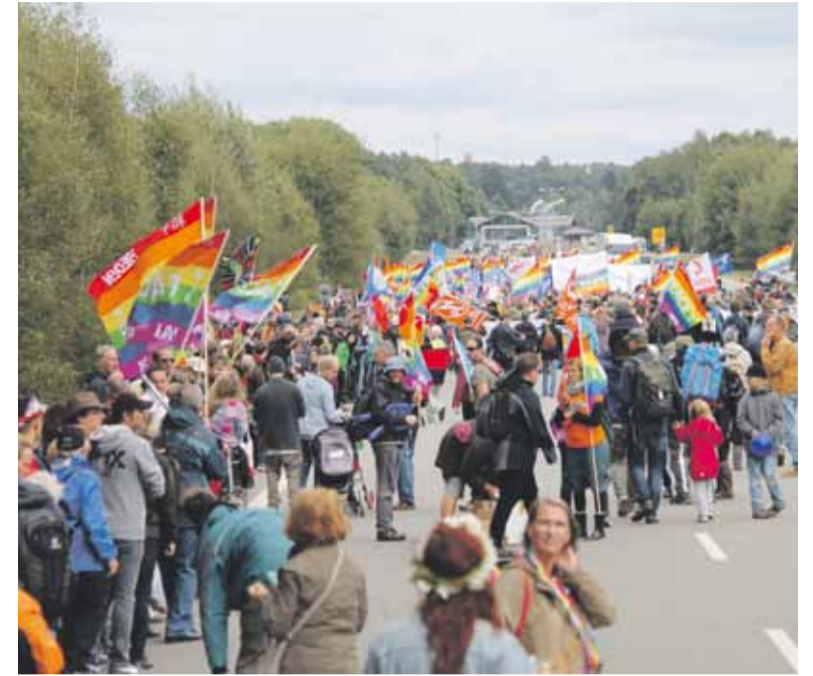
Menschenkette 2017