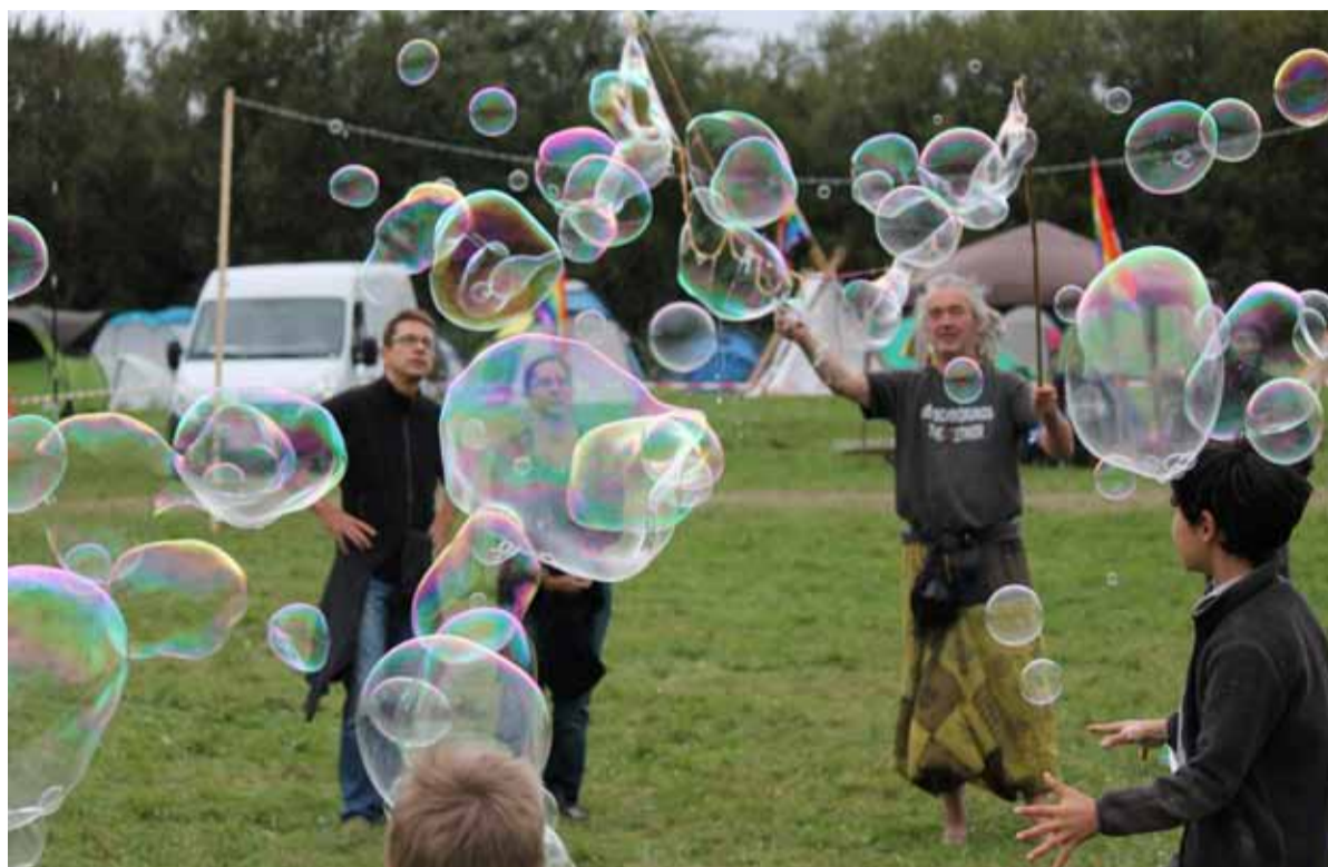
Friedenscamp 2017