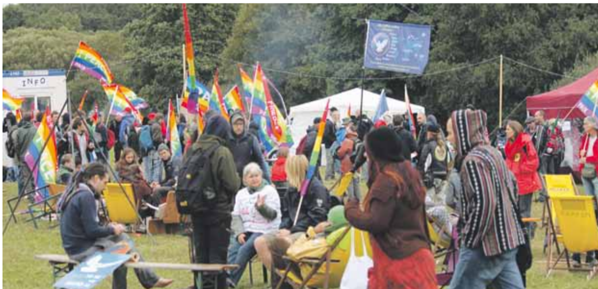
Friedenscamp 2017