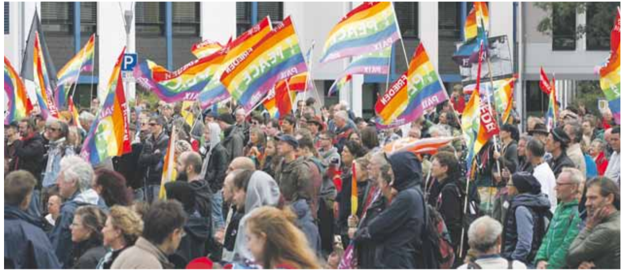
Auftaktkundgebung in Ramstein-Miesenbach 2017

Am 9. Dezember 2017 fand die wieder mit mehr als 80 TeilnehmerInnen und Teilnehmern gut besuchte Aktions- und Planungskonferenz der „Stopp Air Base Ramstein“ Kampagne in Frankfurt a.M. statt.