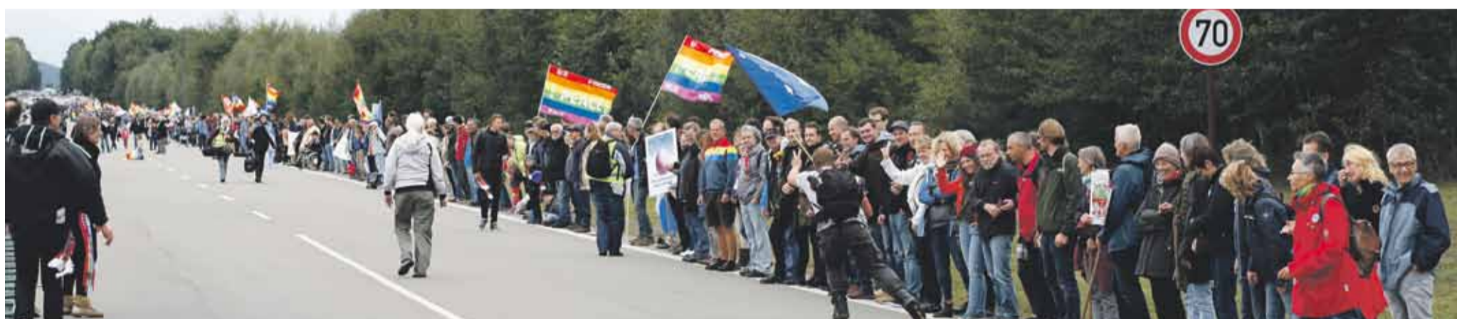
Menschenkette 2017